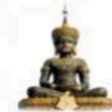
พุทธอุทยานเพชรบูรณ์