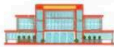
มหาวิทยาลัยการกีฬาแห่งชาติ วิทยาเขตเพชรบูรณ์