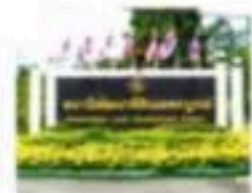
สำนักงานพัฒนาแผ่นดิน จังหวัดเพชรบูรณ์