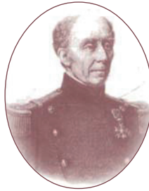
นายพล กีโยม อังรี ดูฟูร์ (Guillaume-Henri Dufour)