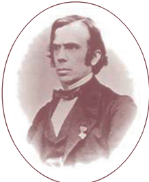
หลุยส์ อับเปีย (Dr.Louis Appia)

ผู้ร่วมก่อตั้งคณะกรรมการระหว่างประเทศ เพื่อช่วยเหลือผู้บาดเจ็บในสงคราม