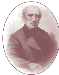
ทีโอดอร์ โมวนัว (Dr.Théodore Maunoir)