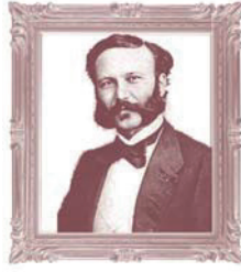
นายอังรี ดูนังต์ (Henry Dunant) ผู้ให้กำเนิดกาชาด

ผู้ร่วมก่อตั้งคณะกรรมการระหว่างประเทศ เพื่อช่วยเหลือผู้บาดเจ็บในสงคราม