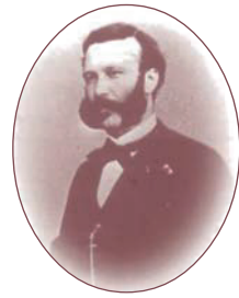
อังรี ดูนังต์ (Henry Dunant)