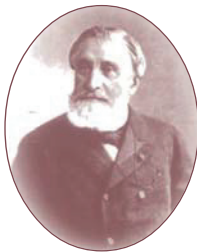
กุस्ताฟ มัวนิเย (Gustave Moynier)