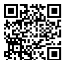
QR Code ไฟล์สลิป