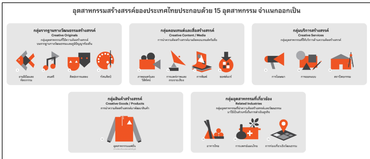
รูปภาพที่ ๑ : การจัดกลุ่มและสาขาอุตสาหกรรมสร้างสรรค์ของประเทศไทย