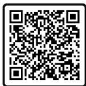
แบบฝึกอบรม ทั้ง 12 แผนก