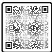
รายละเอียดการสมัคร